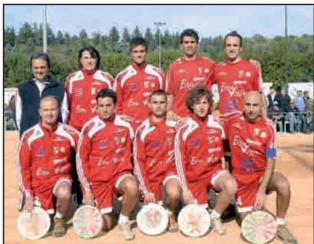
L'A.T. Callianetto, Campione d'Europa e Campione d'Italia 2009